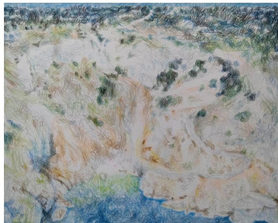
23. 12. 2022. (Orlec - Cres)