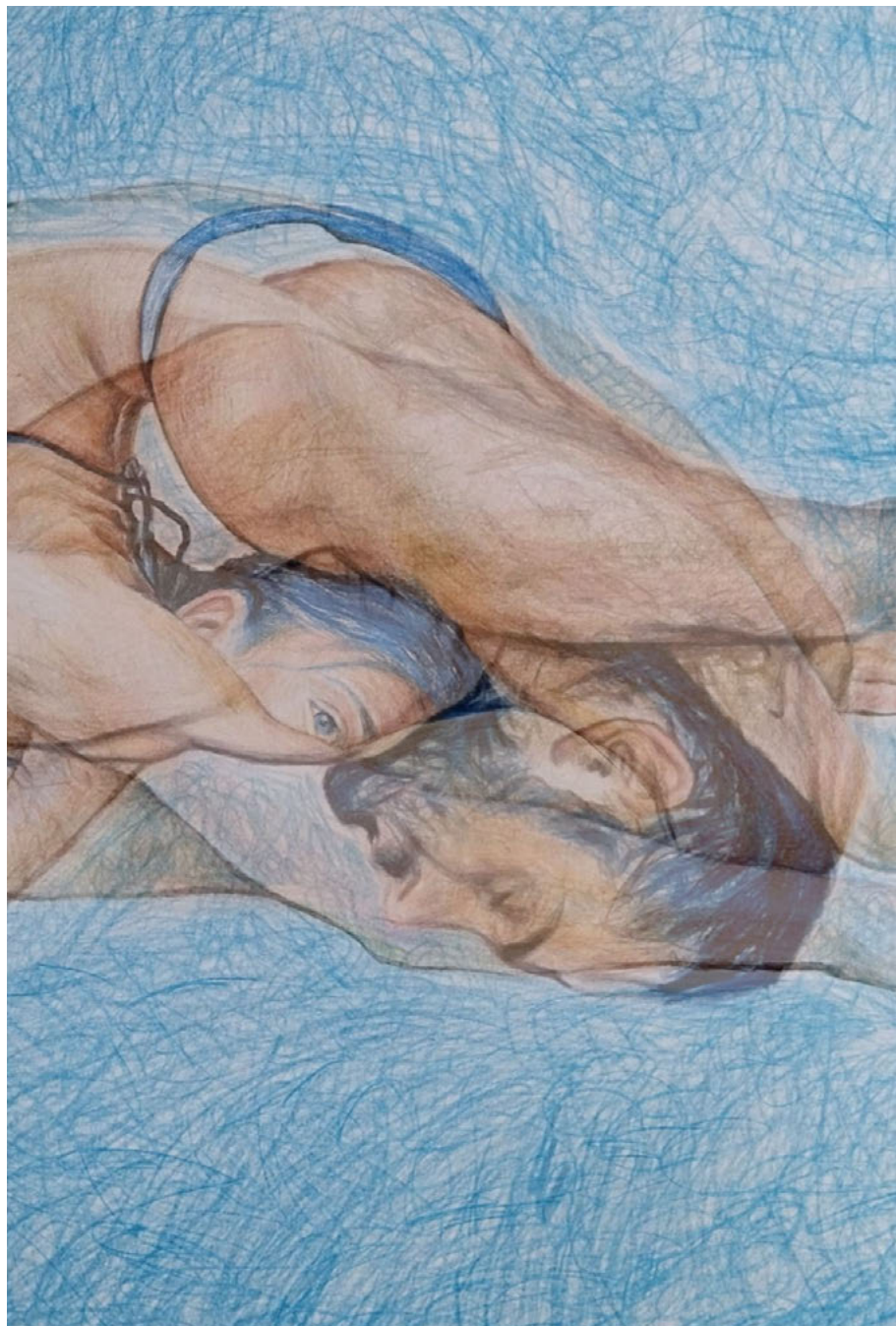
Naslovna stranica: Fragment rada 28. 2. 2023. (Cres)